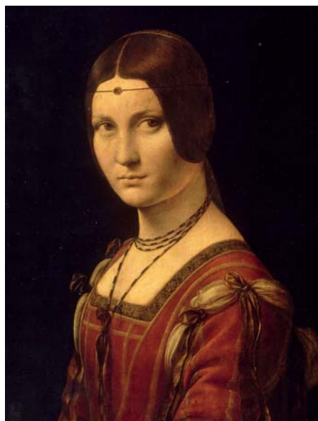
RMN-S-880015-9302 Leonardo da Vinci, Ritratto di dama (La Belle Ferronnière). Parigi, Louvre.

La Réunion des musées nationaux nasce nel 1895 con obiettivo l'acquisizione di opere d'arte destinate a arricchire le collezioni nazionali francesi. L'attività della RMN è oggi nel segno della diffusione culturale delle collezioni mediante le esposizioni e l'attività dell'Agenzia Fotografica, che realizza le campagne fotografiche all'interno dei musei nazionali e regionali francesi. Il patrimonio artistico di queste grandi collezioni, oltre 200.000 fotografie di opere conservate in musei come il Louvre, il Musée d'Orsay, il Centre George Pompidou o il Museo Picasso, è interamente disponibile on-line.