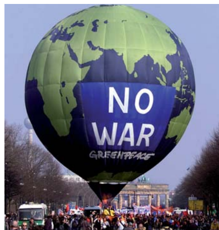
ULL-F-626217-0000 Manifestazione pacifista. Berlino, 2003.

Archivio tedesco generalista nato nel 1900 come reparto fotografico della casa editrice Ullstein, una delle più importanti in Germania. Possiede 12 milioni di immagini, di cui 500.000 disponibili on-line. Argomenti principali: storia, personaggi, arte, cinema e attualità. Ricchissimo di immagini della Germania e molto ben fornito sulla storia europea e mondiale.