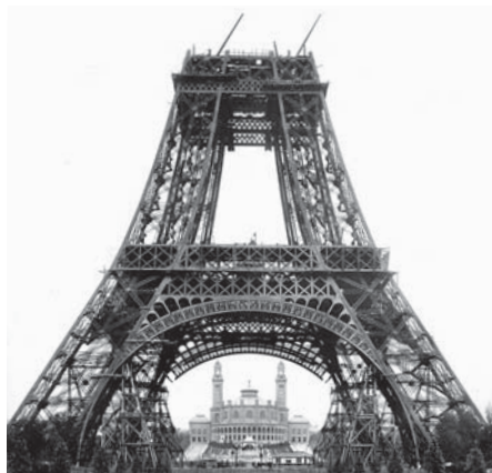
RVA-001081-0013 La Torre Eiffel in costruzione, 1888.