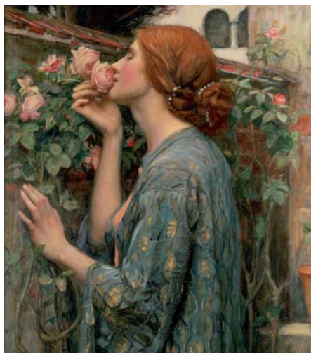
BAD-F-013776-0000 John William Waterhouse, L'anima della rosa. Collezione privata.

Archivio parigino nato nel 1889, che negli anni si è sviluppato fino a possedere 8 milioni di immagini. Attualmente di proprietà del Comune di Parigi, è uno dei più grandi archivi a livello europeo. On-line sono disponibili oltre 200.000 immagini. Argomenti principali: storia, società, politica, personaggi, arte e paesaggio. Particolarmente utile per ricerche sulla Francia e paesi di influenza (ex-colonie).