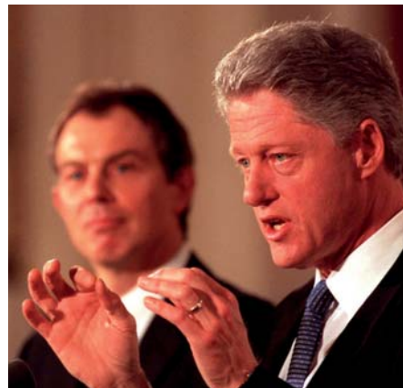
TOP-F-268408-0000 Bill Clinton e Tony Blair alla Casa Bianca. USA, 1998.

Archivio inglese fondato nel 1972, specializzato in immagini di arte, dalla preistoria agli autori contemporanei, di tutto il mondo. Ha rapporti diretti con Musei, Gallerie ed Artisti e si occupa delle richieste di autorizzazioni (esclusi gli autori gestiti da Siae o in proprio). Nel 2001 ha acquisito tutti i materiali dell'archivio d'arte francese Giraudon. Ha molti materiali anche di storia e personaggi. On-line sono disponibili oltre 200.000 immagini.